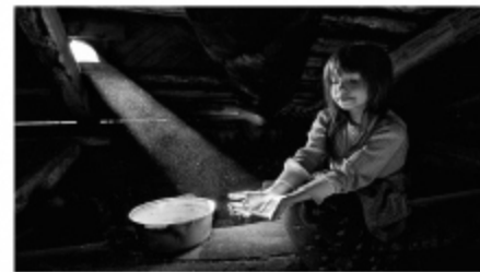
Фотографии с сайта Морского музея

Рядом с фотографиями на выставке показаны работы учеников Соловецкой школы ремёсел. За неделю до начала сезона Соловецкий Морской музей представил в Архангельске выставку «Крест и маяк: навигационные знаки Белого моря в XVI-начале XX века». В 2012 году эта выставка была удостоена Всероссийской историко-литературной премии «Александр Невский» и после этого экспонировалась в Москве и Санкт-Петербурге. В Архангельске она была открыта 31 мая в Северном морском музее. Тогда же между двумя морскими музеями было подписано соглашение о широком сотрудничестве в научно-просветительской сфере.