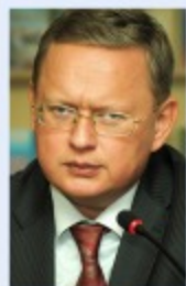
Михаил Делягин , известный экономист, руководитель Института проблем глобализации: