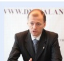
Заместитель губернатора по развитию Соловецкого архипелага Роман Балашов:

В ближайшее время будет объявлен конкурс на замещение должности руководителя ГБУ АО «Дирекция по развитию Соловецкого архипелага», который планируется провести в открытом формате в режиме онлайн-трансляции.