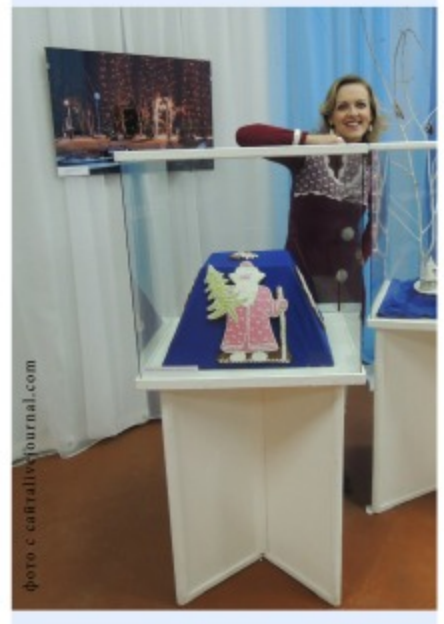
фото с сайта livejournal.com